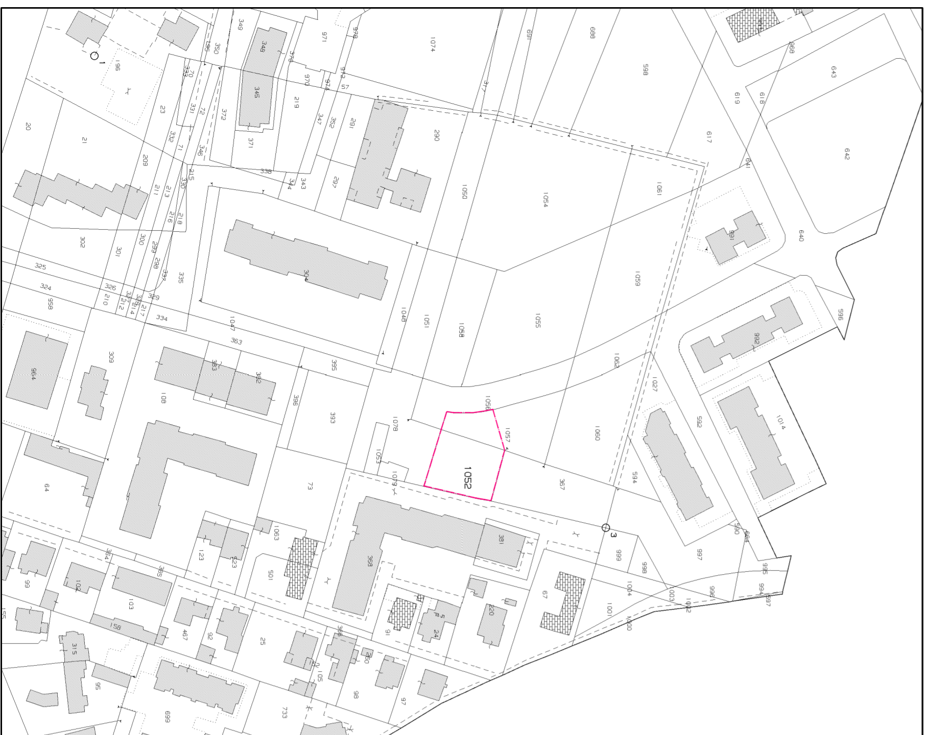
ESTIRATO MAPPA CATASTALE